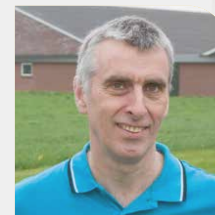
Frank van der Pavert Fokker Danic gelten Wehl

“Wij vinden dat de tijd nu rijp is om als Next Genetix de stap naar HyCare te zetten. Als fokkerijorganisatie zitten we boven in de piramide en onderscheiden we ons al op diergezondheid. Bovendien willen we voorop blijven lopen. In HyCare zien wij die toegevoegde waarde. Wij willen schoon, netjes en strak werken, net als producenten van voedsel dat doen. Met de HyCare-methode brengen wij daar meer structuur in aan. Met een tophygiëne kunnen we kiemen – ook op SPF-varkensbedrijven zijn die volop aanwezig – nóg beter beheersen. Zo werken we doelgericht aan bijvoorbeeld het verder verlagen van de toch al lage salmonella-druk op onze fokbedrijven. De resultaten van onze extra inspanningen druppelen door naar de afnemers van Danic fokgelten. Met HyCare groeien we naar 'the next level'. Op de afzetmarkt onderscheiden we ons met topgenetica, extra gezondheid én imago.”