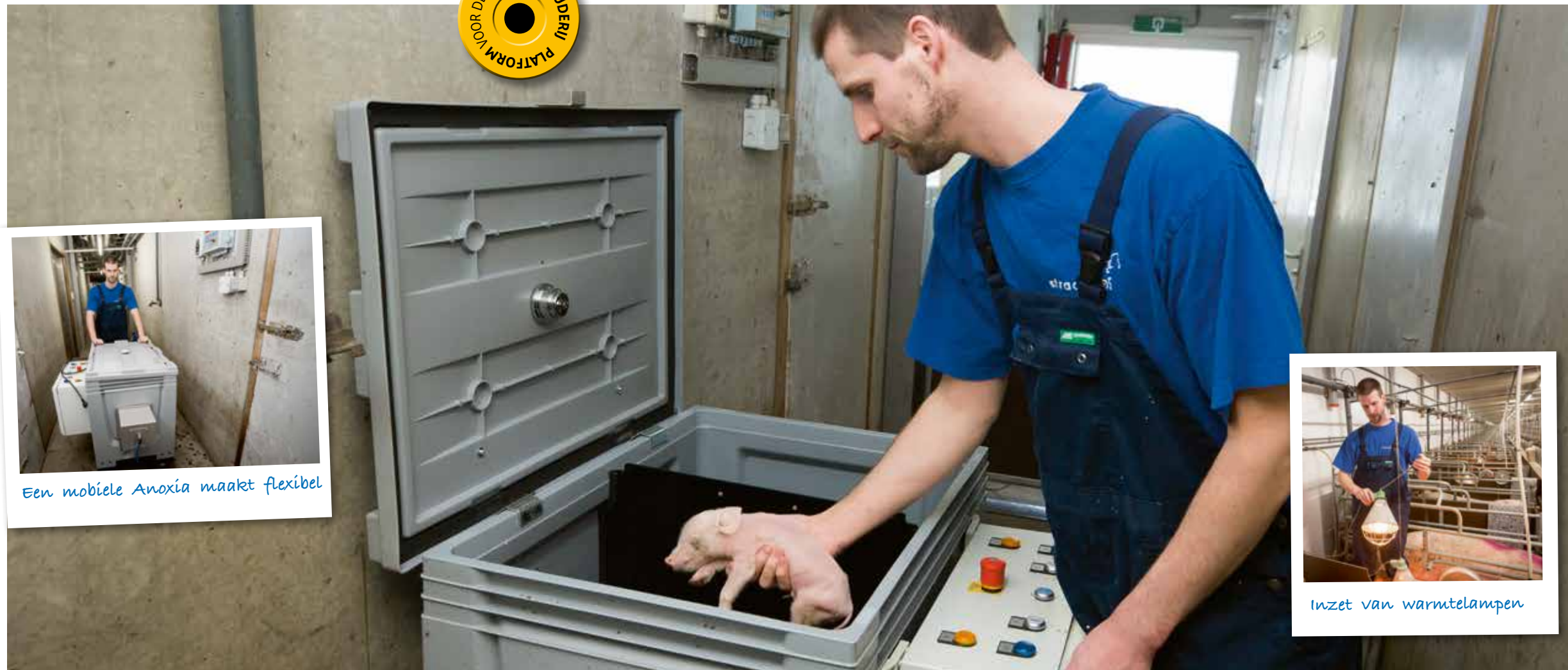
Een mobiele Anoxia maakt flexibel