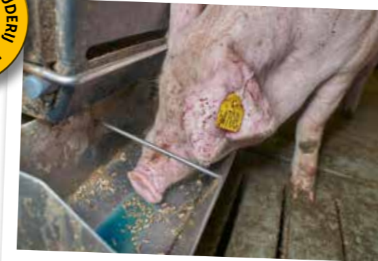
Een opnametijd van 4-5 uur van het PIA-vaccin is ideaal