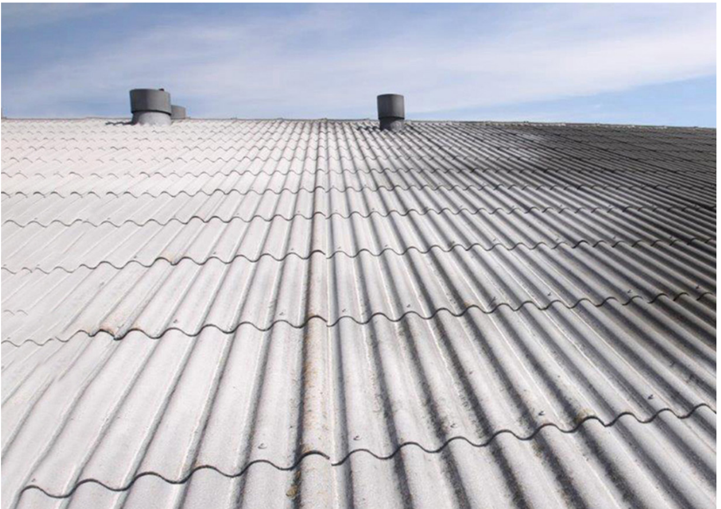
Witkalken van donkere daken